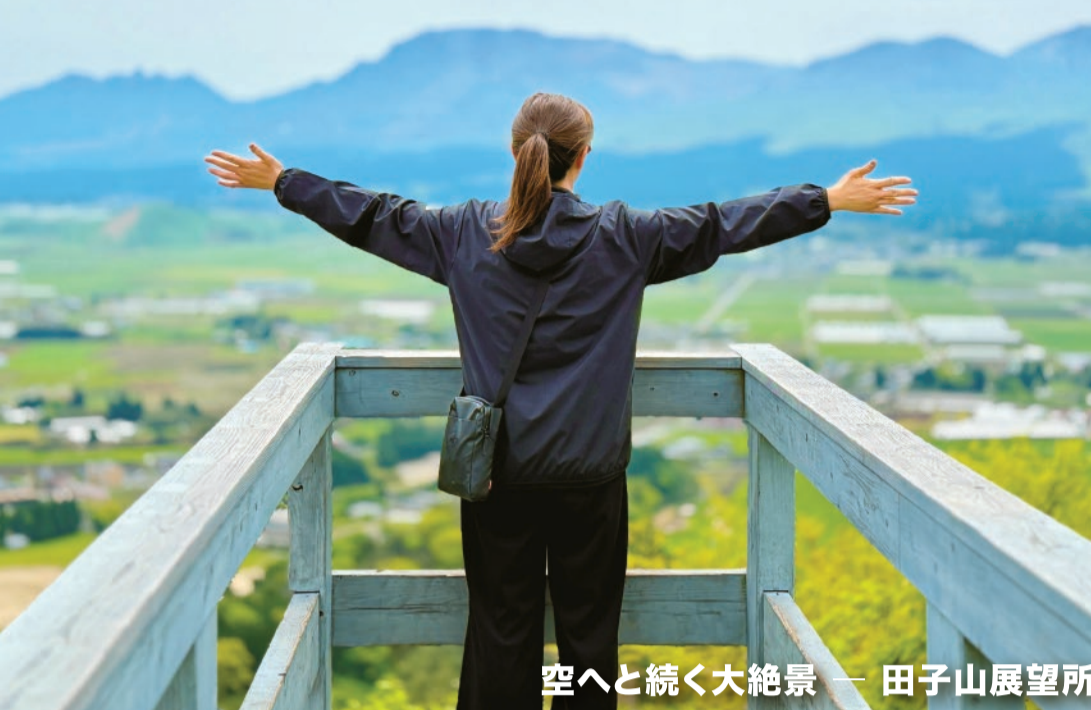
空へと続く大絶景 田子山展望所