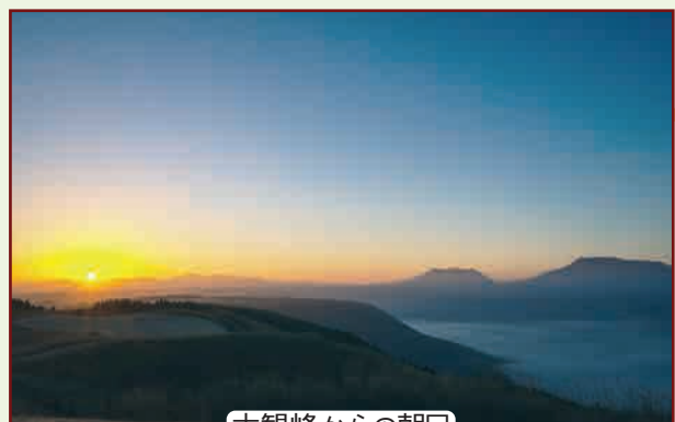
大観峰からの朝日