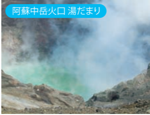
阿蘇中岳火口湯だまり

※中岳火口見学 【冬季時間】 9:00～17:00 (16:30 ゲート閉門) 12/1～3/19