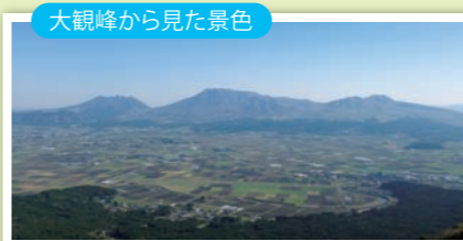
大観峰から見た景色