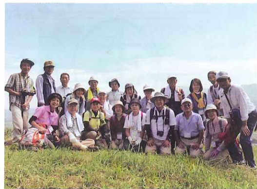
「田子山頂上での集合写真」

内牧温泉街の外れに位置する田子山(たんごやま)には夫婦亀石や「波乗り観音」など珍しい13の神仏が点在しています。そんな田子山を今年も「田子山絆の森委員会」の皆さんに楽しく案内して頂きました。頂上からは阿蘇五岳が一望!だご汁や新米のおにぎりなど手作りのお昼ご飯も最高でした。