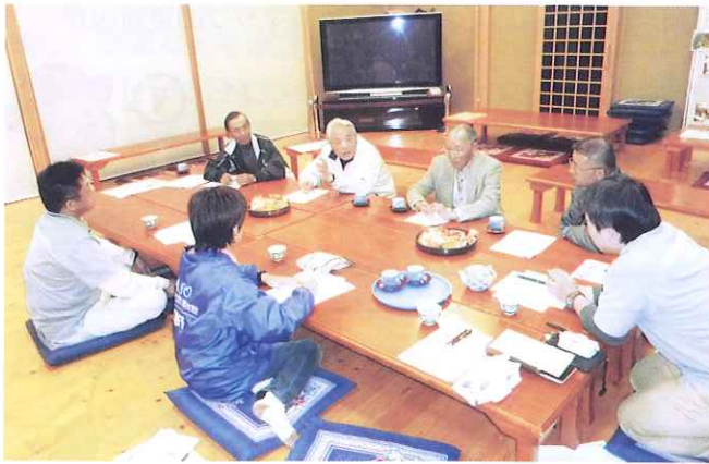
「サテライト地区部会(黒川・役犬原・乙姫)の様子」