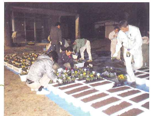
「パンジー植え付けの様子」

通称なべづる線と呼ばれる道路沿いに広がる4つの地区の住民有志によって立ち上げた地域活性化を目的とする大学に模した組織。